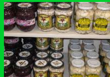
Indústria Hemmer e seus produtos