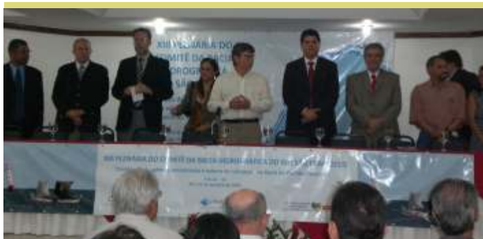
Abertura da Plenária em Aracaju